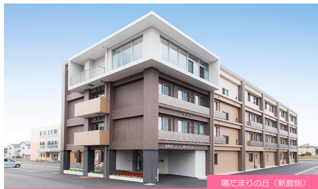
陽だまりの丘（新館側）